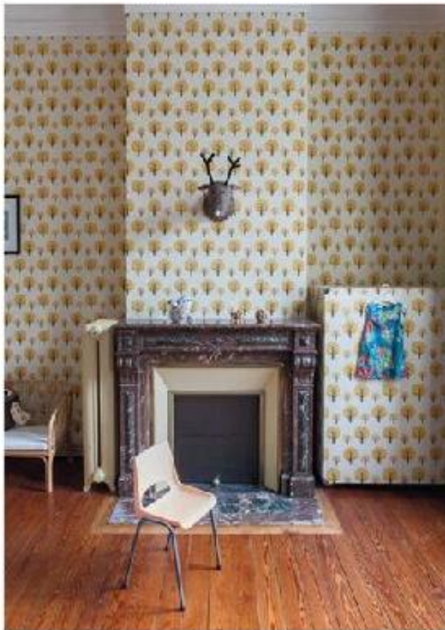
Geen aparte kamers voor de tweeling, wél een gemeenschappelijke slaapkamer en een originele speelruimte.