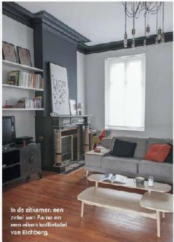
In de zitkamer: een zetel van Fama en een eiken koffietafel van Eichberg.