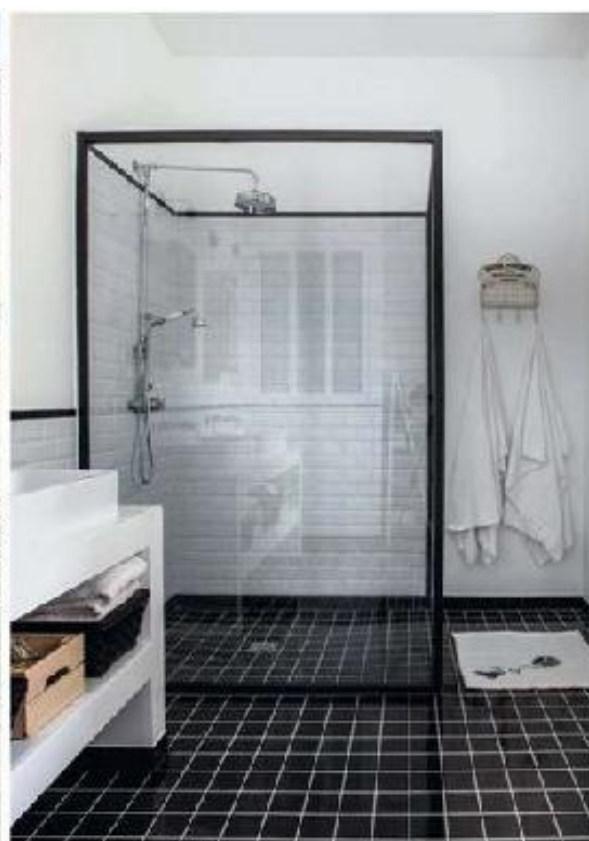
In de sobere en functionele badkamer speelt het contrast tussen zwart en wit de hoofdrol.

> volledig open keuken. Zo blijft er nog een zekere intimiteit bewaard. Deze ruimte is ook in de eerste plaats functioneel. Aan de achterzijde gaat achter een paneel de wasplaats met berghokschuif", gaat Ninou verder.