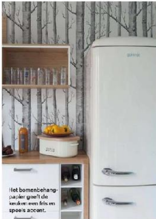
Het bomenbehang- papier geeft de keuken een fris en speels accent.