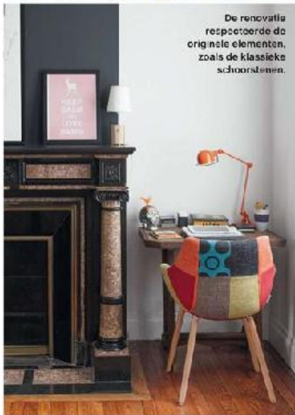
De renovatie respecteerde de originale elementen, zoals de klassieke schoorstenen.