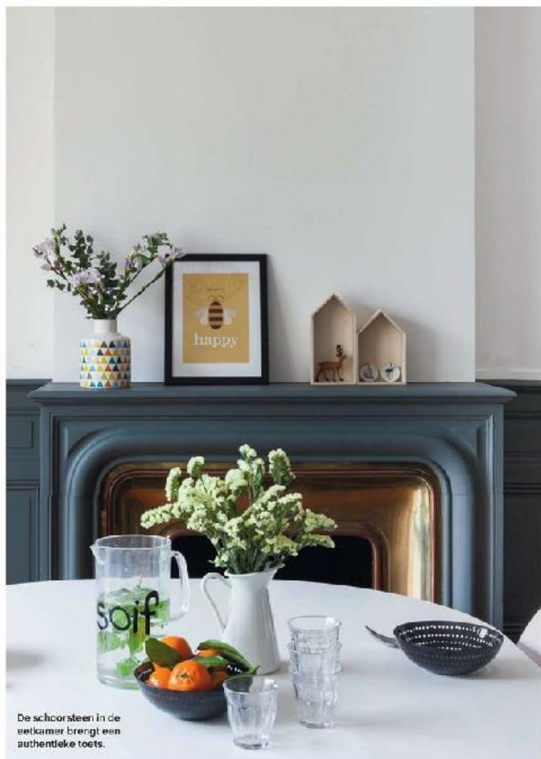
De schorsteen in de eetkamer brengt een authentieke toets.