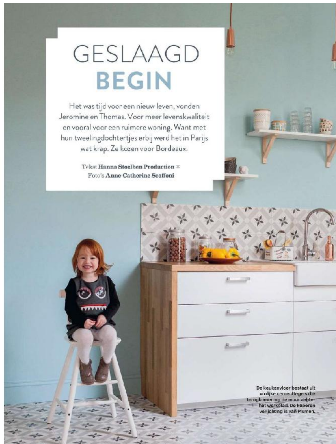
De keukenvloer bestaat uit vrolijke cementtegels die terugkomen op de muur achter het werkblad. De koperen verlichting is van Plumen.

Tekst: Hanna Steelben Production