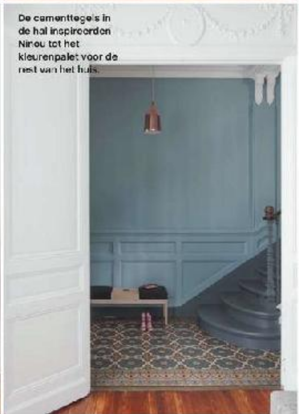
De cementtegels in de hal inspireerden Ninou tot het kleurenpalet voor de rest van het huis.